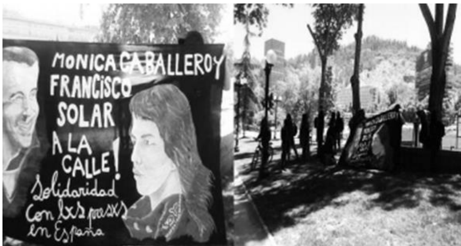
(Mitin solidario en las afueras de la Embajada de España en Chile. Diciembre 2013)

Por supuesto que partimos del hecho de que desde el enemigo no esperamos más que su hostilidad y represión. Por eso las siguientes reflexiones apuntan en el sentido de aportar al análisis para reflexionar/entender el momento y pasar a la acción desde la perspectiva insurrecta de la ofensiva antiautoritaria contra el poder.