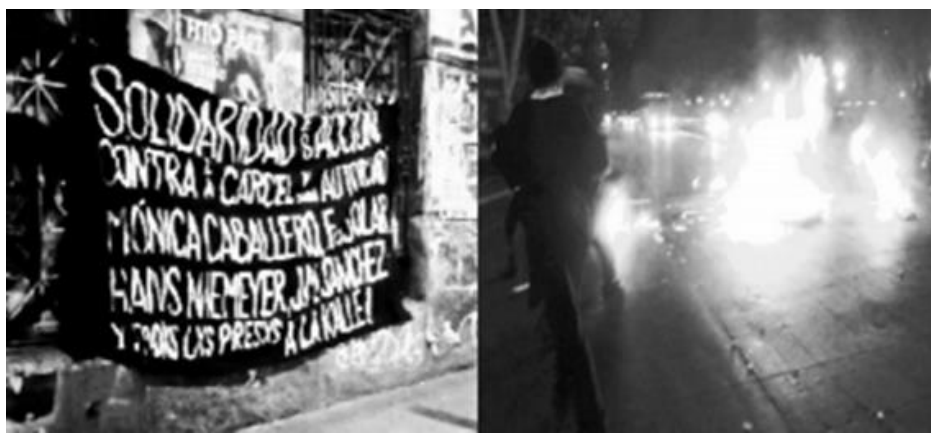
(Barricadas y propaganda en "La Alameda", principal avenida de Santiago, Chile. Diciembre 2013)